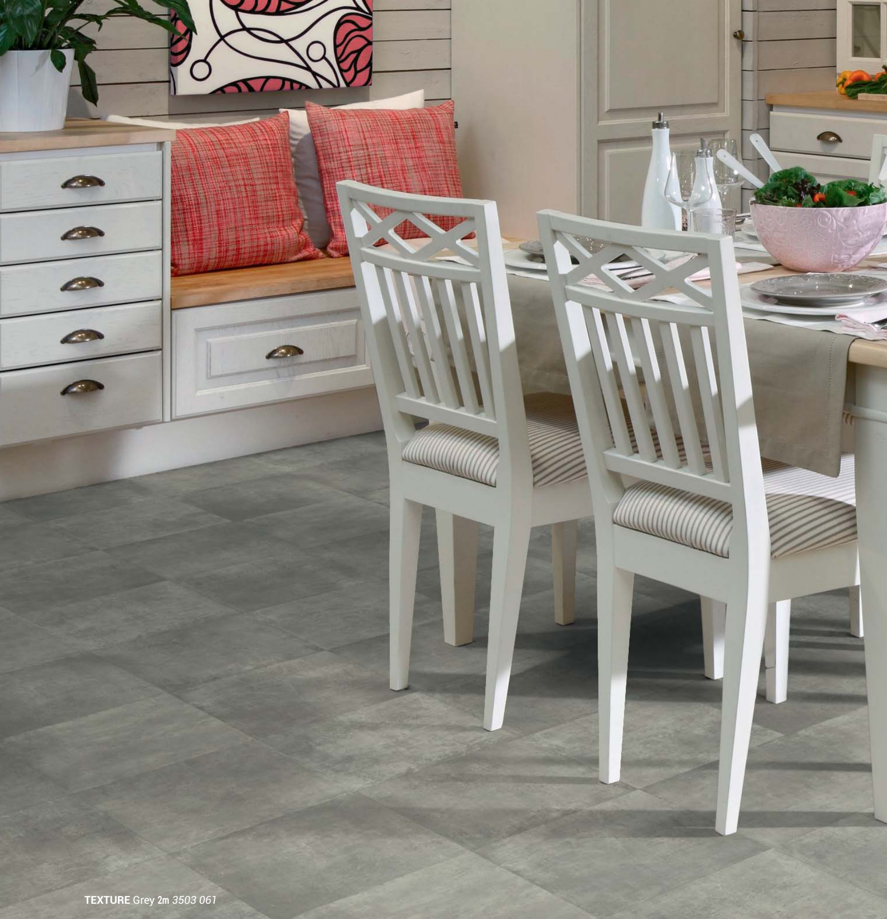
TEXTURE Grey 2m 3503 061