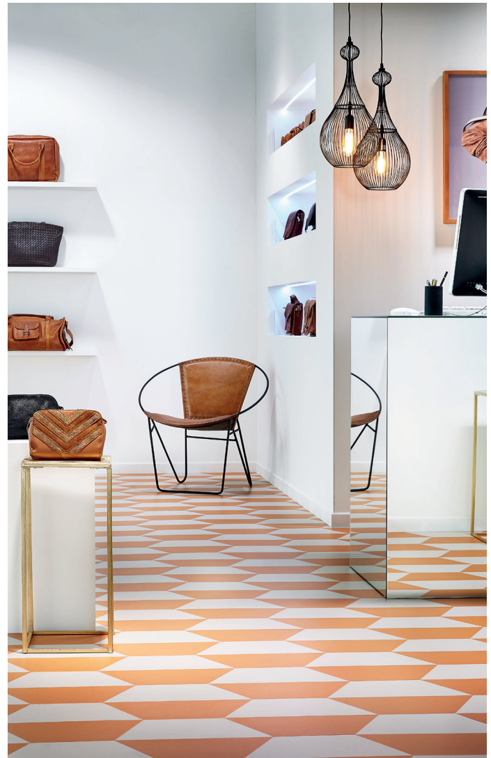
iD Mixonomi lanseras nu i Sverige med fokus på offentlig miljö. Här syns mönstret Precious.

Ett bevis på iD Mixonomis kreativitet är att kollektionen vann produktdesignpriset i den ansedda internationella designtävlingen Red Dot Award 2017, i konkurrens med ca 5 500 tävlande bidrag.