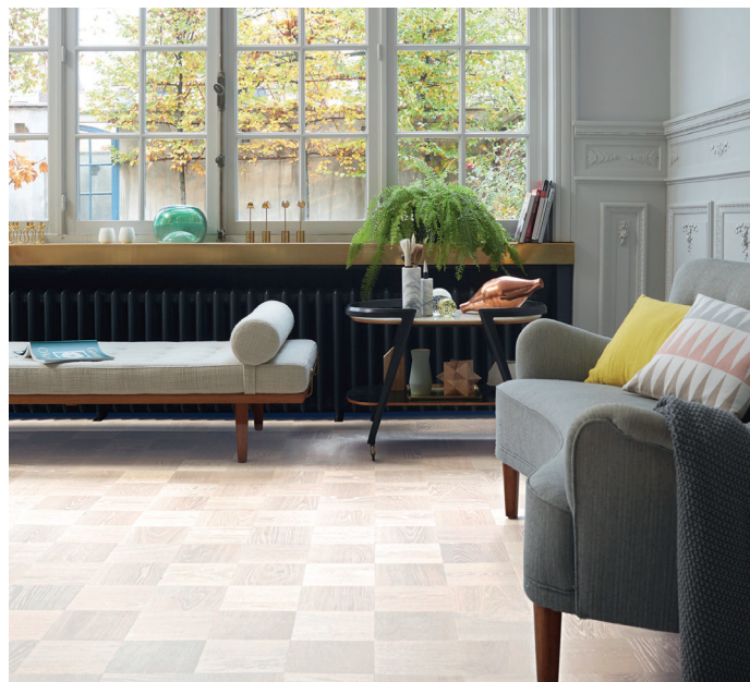
Den pärlemoraktiga nyansen i golvet Noble Ek Greenwich kombinerar klassisk mönstertradition med modernt designuttryck.

Alla golv i Noble- och Heritage-kollektionerna läggs precis lika enkelt som Tarketts övriga trägolv, dvs. med klicksystemet 2-lock. Golven är omslipningsbara 3–4 gånger och anpassade för det nordiska klimatet där det är stor skillnad i luftfuktighet mellan sommar och vinter.