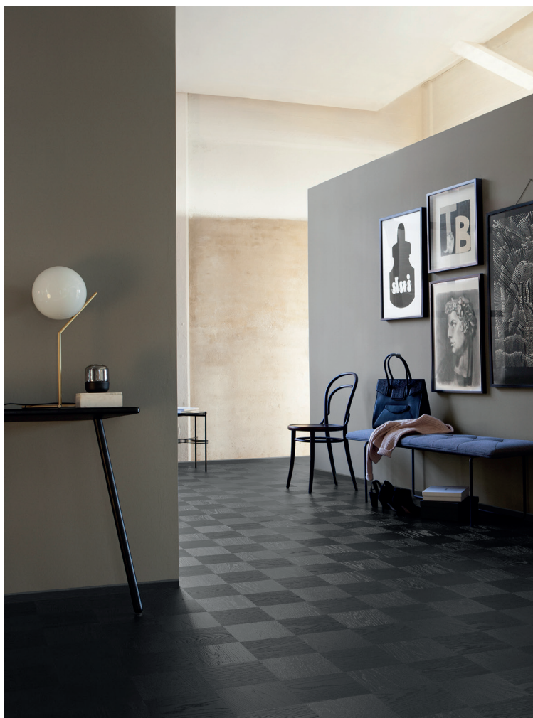
Noble Ek Broadway , ett elegant trägolv i ett sofistikerat kvadratisk rutnmönster.