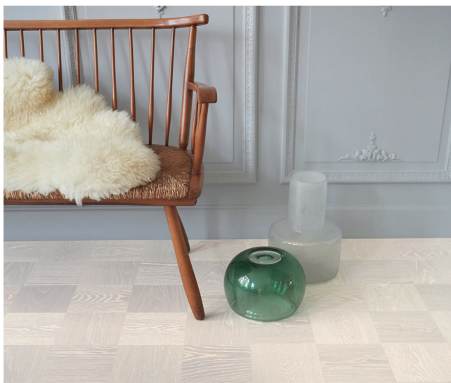
Noble Ek Greenwich är inspirerad av New York-stadsdelens konstnärssateljéer med dess sobra miljöer.

De större rutorna i Noble-kollektionen finns i tre olika färgställningar: Noble Ek Greenwich , Noble Ek Soho samt Noble Ek Broadway . Kvadraterna är 19x19 cm och läggs med träriktningarna mot varandra så att ett dynamiskt rutnmönster uppstår i varje enskild bräda. Detta förstärks av att ytan borstas och behandlas med hårdvaxolja.