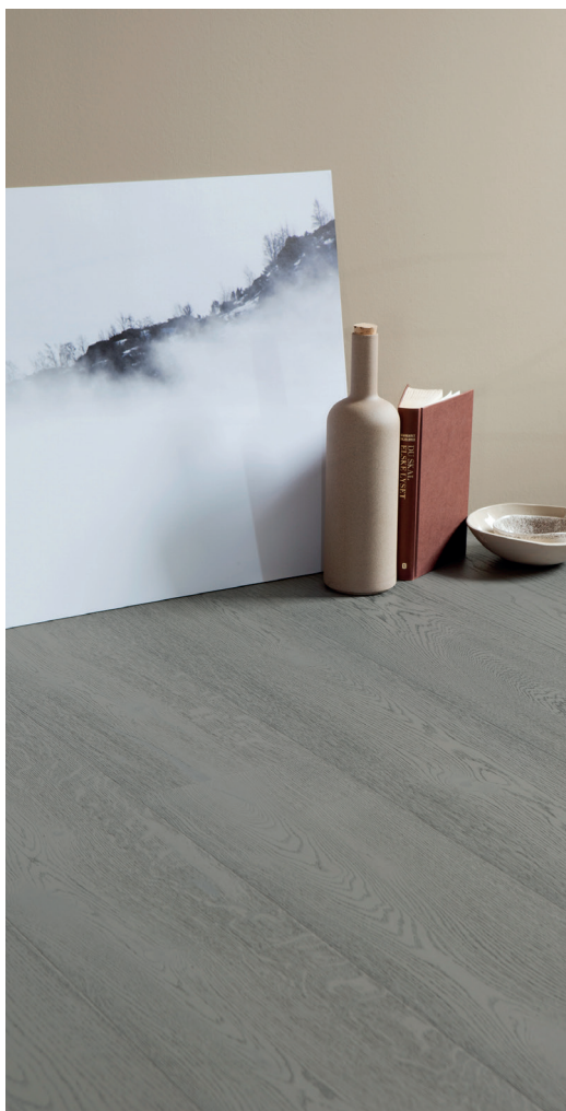
Heritage Ek Dove Grey med sin gråpigmenterade hårdvaxolja ger en varm och behaglig känsla.

Nyheterna i Heritage-kollektionen heter Heritage Ek Opal White och Heritage Ek Dove Grey . Träråvaran till de här golven är speciellt utvald för sin livfullhet med naturliga kvistmärken och sprickor. Ytan är borstad på djupet för att lyfta fram träets struktur och ådring och för att varje bräda ska framträda ytterligare har plankorna fått en handgjord minifasning.