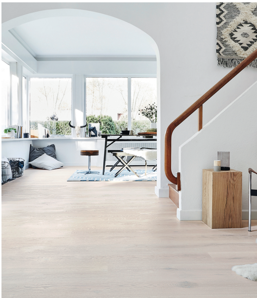
Vackra Heritage Ek Opal White visar ett ljust rustikt golv behandlat med en nästan täckande vitpigmenterad hårdvaxolja.

Vårens nya trägolv finns för leverans från och med april 2017.