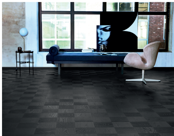
Nyheten Noble Ek Broadway , ett svart trägolv i kvadratisk ruttmönster.