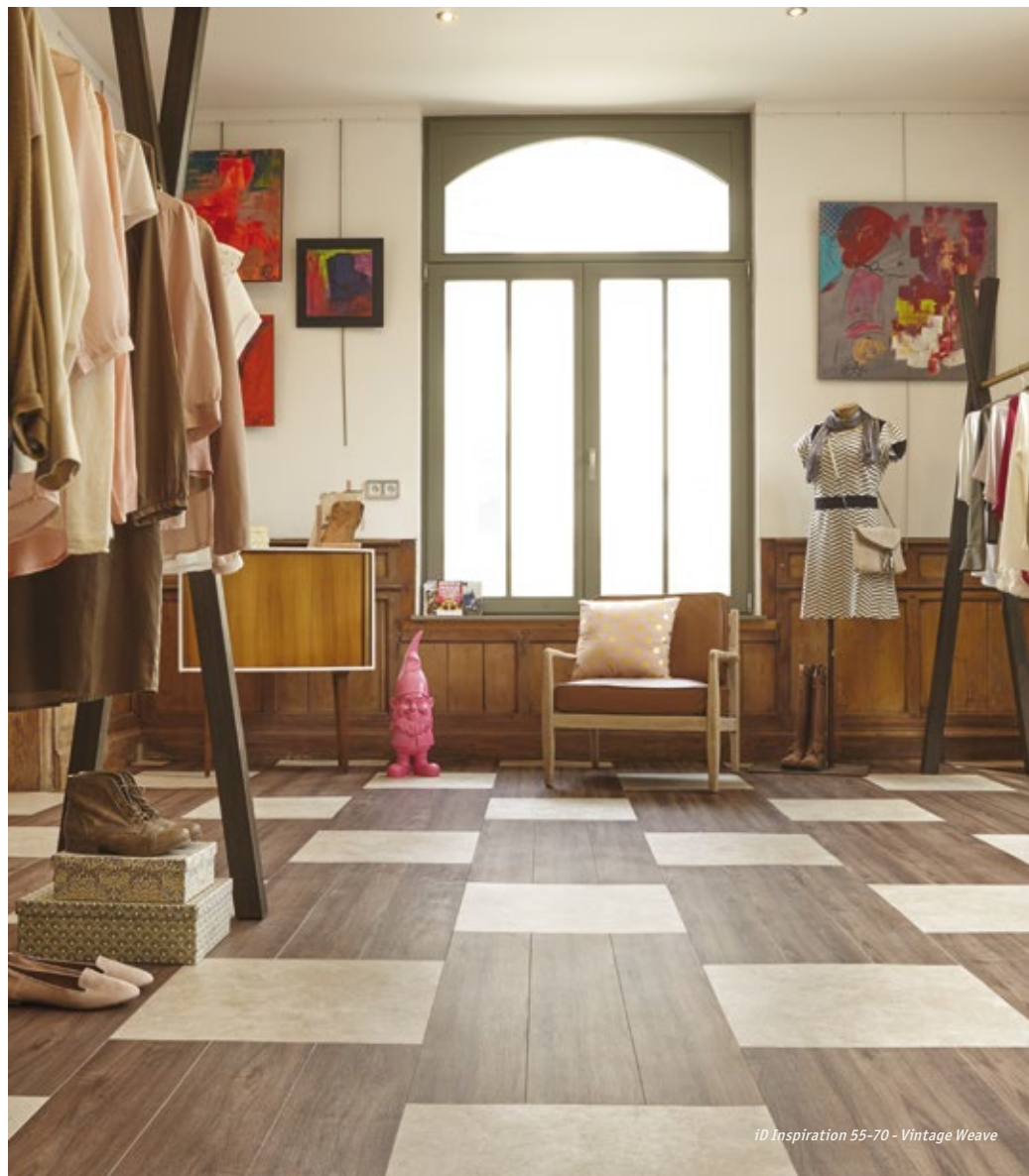
iD Inspiration 55-70 - Vintage Weave