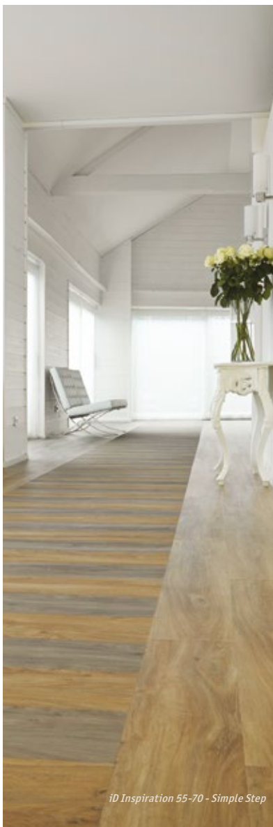
iD Inspiration 55-70 - Simple Step

Les prescripteurs peuvent créer leur propre calepinage en choisissant dans les gammes LVT : le produit, le décor et la couleur désirés. Une fois finalisée et signée, leur création sera publiée sur des sites spécialisés sous formats publicitaires.