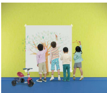
ProtectWALL : 37 décors design

ELU PRODUIT DU BTP PAR LES PROFESSIONNELS 2013