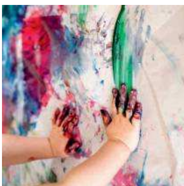
ProtectWALL : résistance accrue aux chocs chimiques et mécaniques