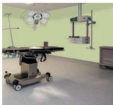
ProtectWALL : haute technicité pour les zones à atmosphère contrôlée

La protection murale décorative ProtectWALL conçue par Tarkett , leader mondial des revêtements de sol, est consacrée par le label « Elu produit du BTP par les professionnels » pour l'année 2013, dans la famille « aménagements intérieurs », catégorie second oeuvre. Innovante, design, et performante, cette protection murale en PVC est destinée à la protection des murs contre les agressions mécaniques et chimiques. ProtectWALL est une solution idéalement destinée aux établissements de santé et établissements scolaires .