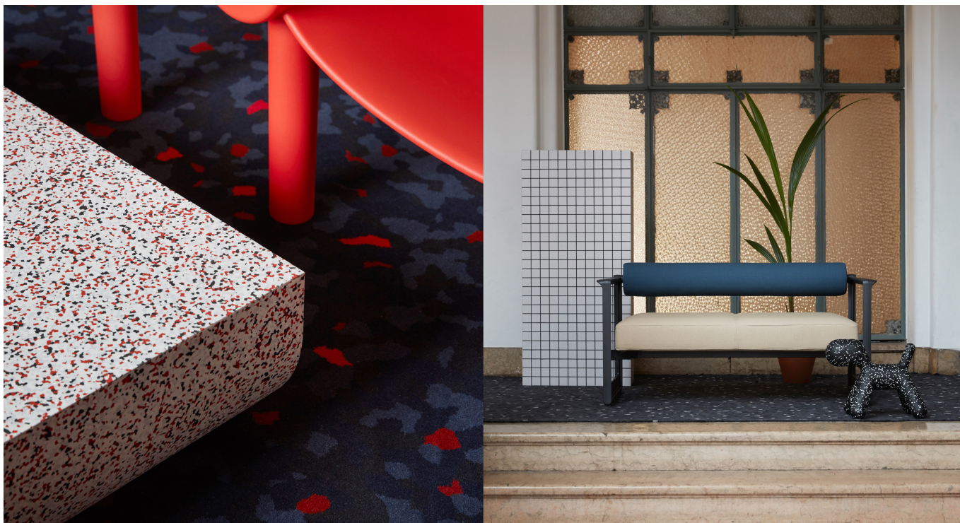
I midten af Formations er en scene, der viser et udvalg af Magis' tidløse og ikoniske møbler. Scenen giver de besøgende et perfekt udkig, hvor de kan læne sig tilbage og nyde installationen.

Tarkett har i år besluttet sig for at finde sammen med designbrandet Magis, da de to virksomheder både har fælles værdier og en udfordrende tilgang til design, der flytter grænser. Magis er en dynamisk familiedrevet iværksættervirksomhed med industrikultur og en lang række banebrydende og tidløse produkter. Møbelbrandet arbejder med en række internationalt anerkendte designere, der skaber kollektioner i meget høj kvalitet, og som indeholder højfunktionelle og teknologiske kvalitetsprodukter. Til Formationsinstallationen er der nøje udvalgt ikoniske møbler som fx Konstantin Grcic's Brut sofa med dens cylindriske ryg. Magis er den perfekte partner for Tarkett, når materialernes fulde potentiale og skønhed skal kommunikeres til et større publikum.