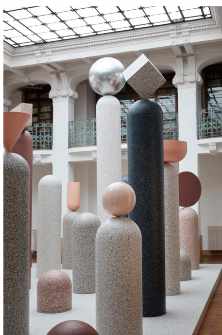
Kegler, ringe, terninger og kugler pryder installationen