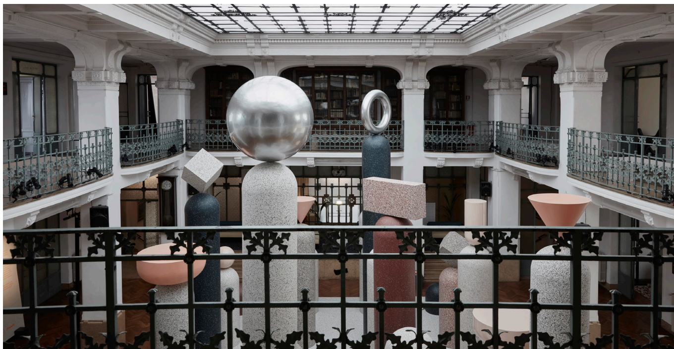
Volumen, overflade, kurver og former kombineres i installationen Formations