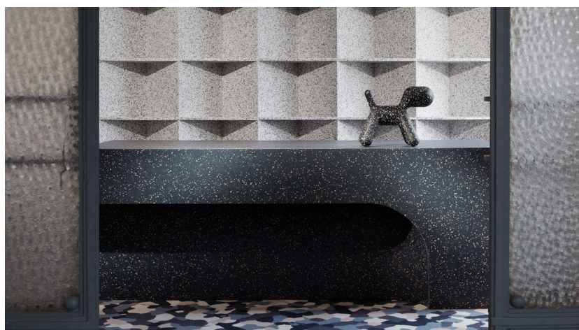
Mødelokale skabt med Tarkett iQ Surface, Desso tæppe og møbler fra Magis.