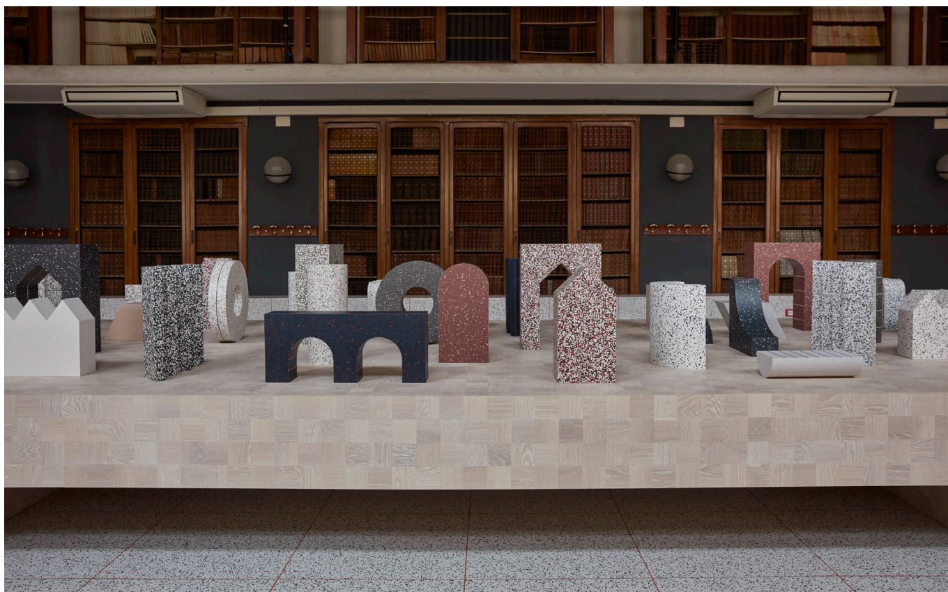
iQ Surface's kreativitet og muligheder er eksemplificeret i biblioteket.