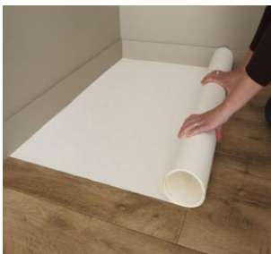
Pose d'une sous-couche de type Tarkoplan sur parquets et laminés « flottants »

- Dans le cas d'une pose sur sols dits flottants, c'est-à-dire sur des produits non collés au sol comme les laminés ou les parquets « clics », il est important de ne pas poser Starfloor directement sur ces sols qui contiennent du bois et qui sont susceptibles de bouger suite à des variations de température ou d'humidité dans la pièce. Il est donc vivement recommandé de poser une sous-couche non collée de type Tarkoplan sur le parquet ou le laminé avant d'entamer la pose de Starfloor. Starfloor peut être posé ensuite sur la sous-couche.