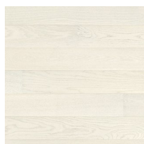
Play Ash Ivory Plank

1: Fraxinus Angustifolia, 2: Quercus Alba, 3: Quercus Robur & Quercus Petraea