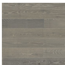
Play Oak Marble Plank