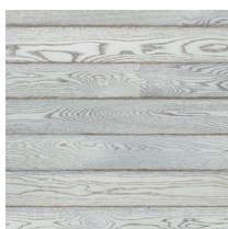
Play Oak Winter Plank